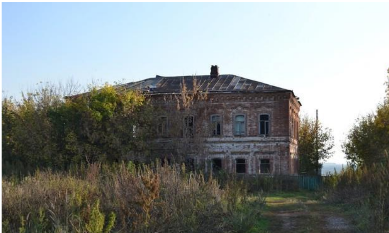
В селе Красный Бор сохранилось здание конторы пароходства (архитектурнпамятник конца XIX — начала XX веков)