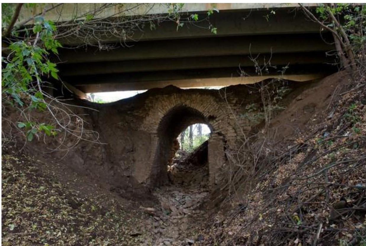
Мост в селе Сарсак-Омга сохранился с екатерининских времен

В 5 км от Терси на реке Чаж находится крупное удмуртское село Сарсак-Омга, жители которого так же, как и их соседи принимали активное участие в Крестьянской войне 1773—1775 годов под предводительством Е.И. Пугачева. Через село проходил Елабужско-Сарапульский почтовый тракт, и с екатерининских времен до наших дней здесь сохранился мост (и это настолько удивительно, потому что поверх него проходит современный бетонный мост, проезжая по которому не возникает даже мысли, что это «два моста в одном»; надо сказать спасибо строителям, которые не стали разрушать старый мост). Местные жители говорят, что по легенде войска Пугачева останавливались около моста, а «сам Пугачев здесь точил саблю».