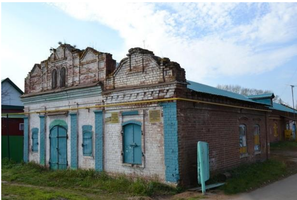
Самая-самая широко известная деревня района — это Иж-Бобья